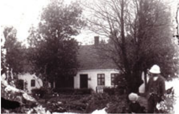
Øster Dørkenvej 3, omk. År 1900