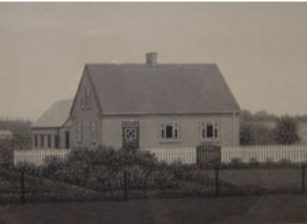
Øster Dørkenvej 10. år 1940