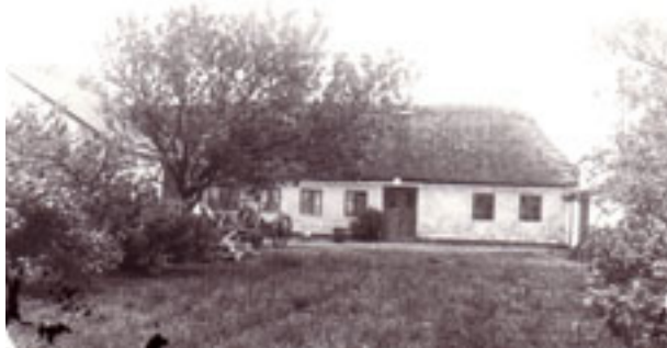
Øster Dørkenvej 8 omk. År 1900