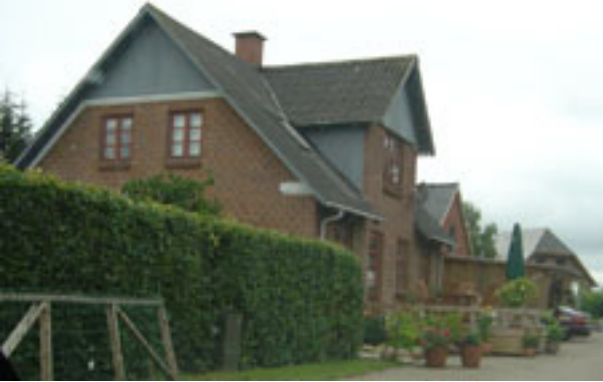
Dørkenvej 7 år 2005