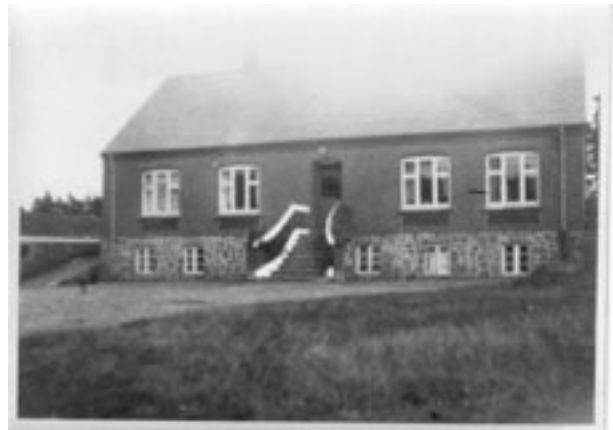
Nyt stuehus på "Tirsgaardslund" 1912