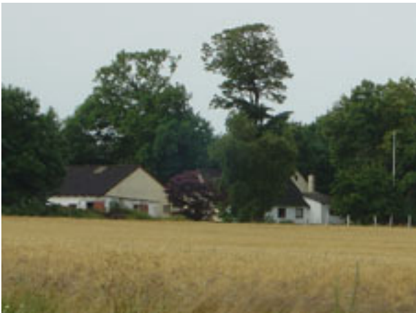
Øster Dørkenvej 8 år. 2005