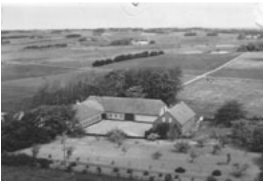
Tirsgaardslund efter sidste ombygning i 1952

Han overtog gården ved skøde fra moderen den 6 okt. 1933. Prisen var 33.000 kr. gården var sat til 21.000 kr. resten var for avl, maskiner og dyr bl.a. 3 heste, 14 køer, 8 ungkreaturer, 2 grisesøer, 14 ungsvin samt høns. Ifølge skødet havde han ingen penge, han overtog et kreditforeningslån på 18.000 kr. og fik et pantebrev på 15.000 kr. hvoraf det sidste afdrag blev betalt i 1945. Han ombyggede alle gårdens avlsbygninger.