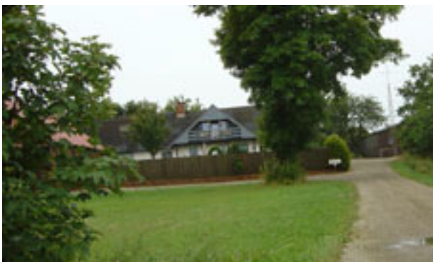
Øster Dørkenvej 3. år 2005